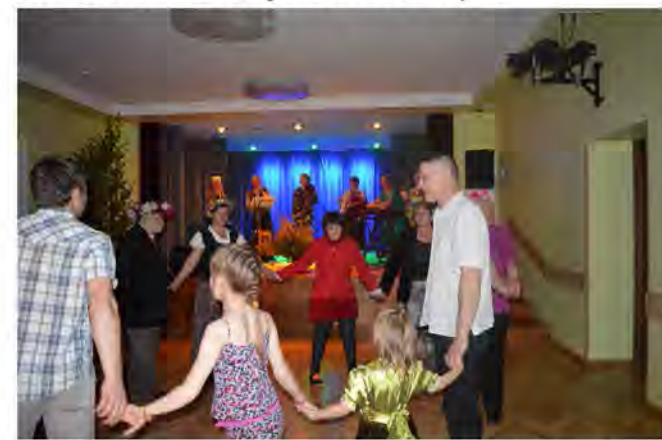
Brīdis no saulgriežu ielīgošanas

nakts ieskandināšana kopā ar Lubānas kapelu “Meldiņš”. Laikapstākļi veica savas korekcijas un pasākums norisinājās iekštelpās, taču tas ne-traucēja baudīt un līksmot, lai ieskandinātu Jāņus. Starplaikos starp muzikālajām pauzēm izspēlējām dažādas latviešu rotaļas, nogaršojām sieru un baudījām miestīņu.