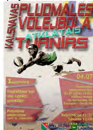
Pludmales volejbola afiša

• tiks novadīta BEZMAKSAS izglītojoša un praktiska nodarbība Latvijā pazīstamās un iedvesmojošās netradicionālās ārstēšanas speciālistes Ineses Ziņģītes vadībā - apbrīnojami enerģiska sieviete, kas pati sevi