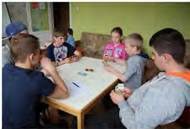
Moments no UNO mača