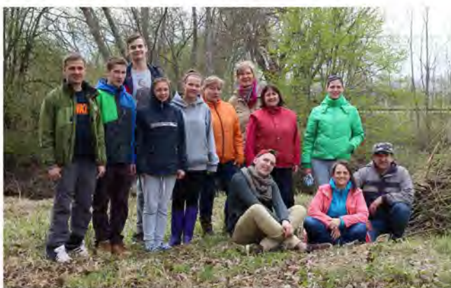
Izturīgākie kalsnavieši pēc talkas

Sekoiet līdzī informācijai par nākamajām aktivitātēm parka labiekārtošanas darbos!