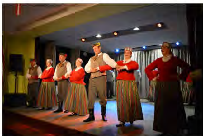
Uzstājas senioru deju kolektīvs „Jāņukalsns”