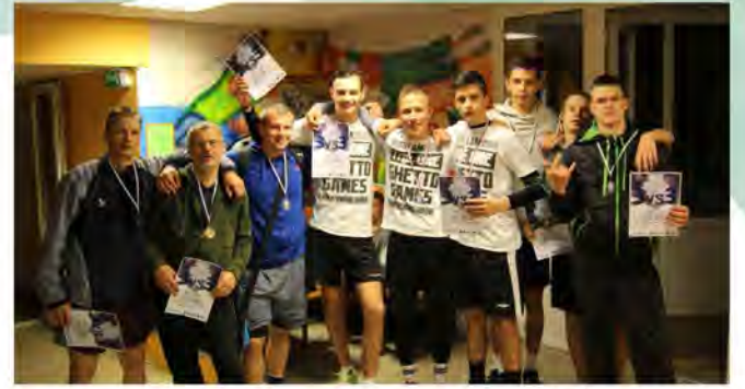
Pirmo 3 vietu ieguvēji

Nākamais, 2. posms, jau 17. jūlijā, savukārt pēdējais, 3. nakts posms, kurš sāksies nevis 19:00, kā ierasts, bet gan 22:00, plānots 21.08.