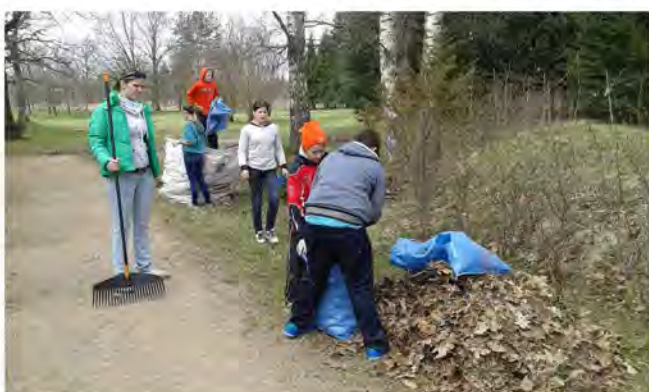
Kalsnavieši aktīvi talko

Talkas laikā čaklākie Kalsnavas pagasta iedzīvotāji grieza zarus,