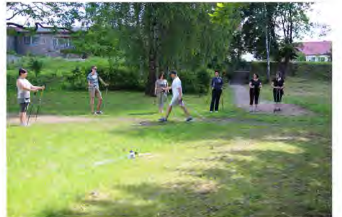
Moments no nūjošana nodarbības

izcēla no paralizēta stāvokļa un arī tagad, 75 gadu jaunībā, saka: „Lai cilvēks būtu vesels, viņam vajadzīgs svaigs gaiss, ūdens un laba asinsrite. Tas ir vienīgais, kas uztur cilvēku