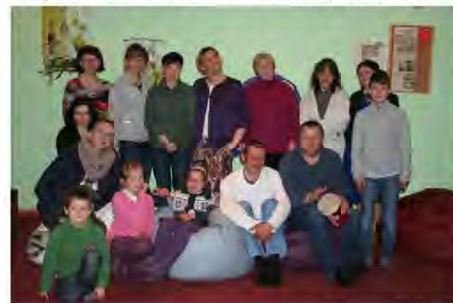
Bilde no tikšanās

Šī ir viena no iespējamām Kalsnavā būt kristīgā sadraudzībā un pieaugt Dievā. Nāc, redzi un piedzīvo!