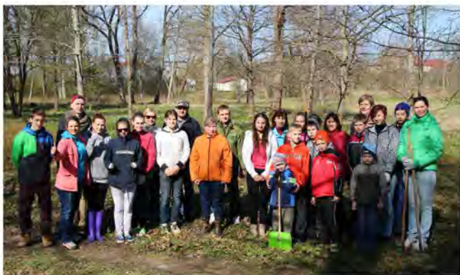
Visi talcinieki pirms darba

Kalsnavas pagastā dzīvo 1880 iedzīvotāji, kuriem ir svarīga pagasta turpmākā pastāvēšana, tā attīstība. To pavisam noteikti pierāda Lielā talka, kas notika 25. aprīlī un kuras ietvarā Kalsnavas pagasta darbīgie ļaudis sakopa parka teritoriju.