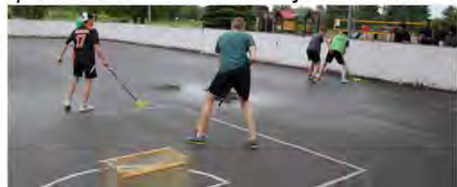
Epizode no spēles

pašiem spēlētājiem. Pēdējās grupu spēles tika aizvadītas jau manāmā