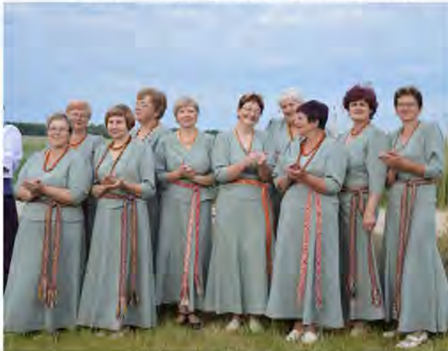
„Magnoliju” kolektīvs festivālā

labākās nākamā gada festivālā dejos visi kolektīvi, kas piedalīsies. Dāmu deju grupai „Magnolija”