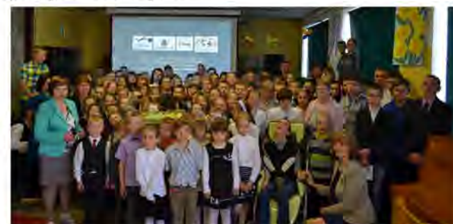
Projekta noslēguma pasākums

Projektu finansē Eiropas Savienības Mūžizglītības programma.