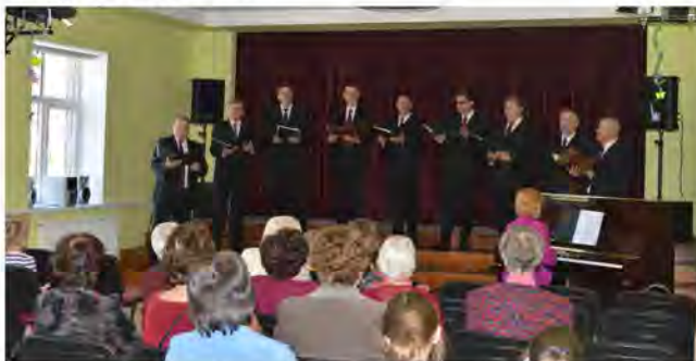
Uzstājas vīru vokālais ansamblis „Kalsnava”

10. maijā Kalsnavas kultūras namā notika sirsnīgs un gaišs Māmiņdienai veltīts koncerts. Koncertā piedalījās jauniešu deju kolektīvs „Kalsnava” un vīru vokālais ansamblis „Kalsnava”.