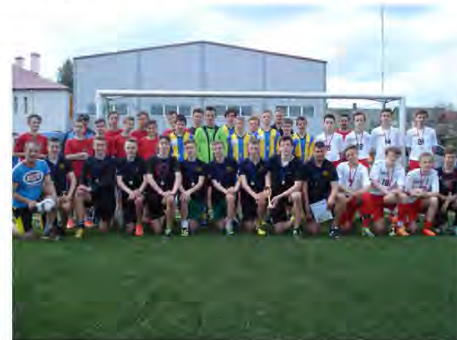
Foto no finālsacensībām

lielus panākumus arī turpmāk, kā arī pārējiem kalsnaviešiem veiksmi!