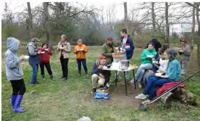
Pēc talkas pelnītā zupa

Pēc talkas talcinieki tika aicināti uz lielo zupu. Lielākais talkas ieguvums, kā secināja paši talcinieki, bija gandarījums un prieks par paveikto.