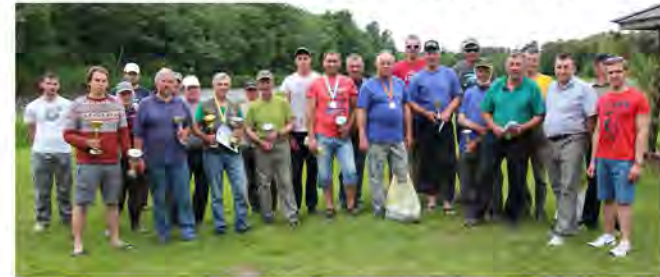
Dalībnieku kopbilde pēc apbalvošanas

Svētdienas pēcpusdienā šķiroties, visi izteica vēlējumu, lai šis pasākums turpinātos arī turpmāk.