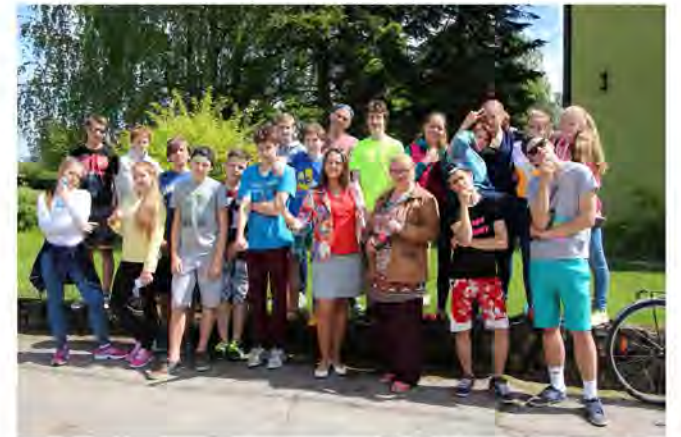
Tikšanās ar Rīgas viesiem