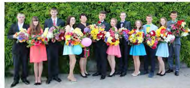
Absolventi izlaiduma dienā