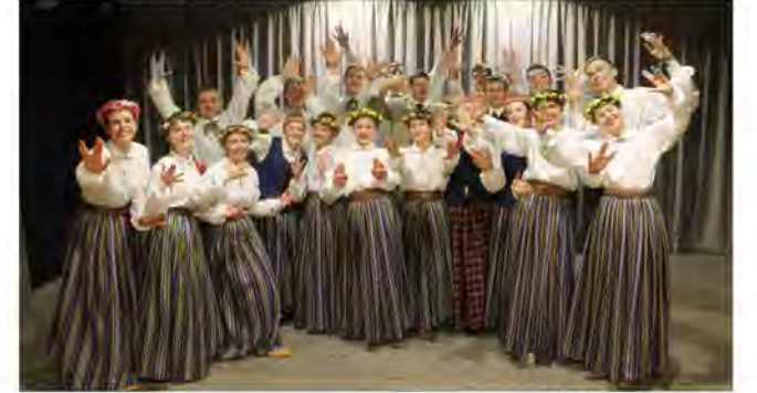
JDK „Kalsnava”

nogalēs pēc deju nolemta laika. Neskaidrību gadījumā sazinies ar Daci vai kultūras nama vadību.